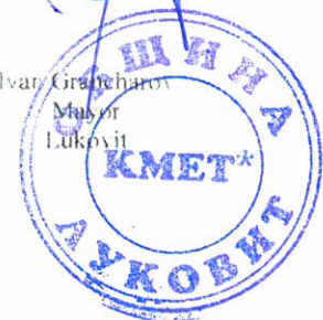
Ivar Grachev Mayor Lukovit

The ROMACT Programme is implemented in municipalities in several countries. The ROMACT process of around 20 months involves four steps: commitment, agreement on needs and plans, design of actions and projects, funding, implementation and monitoring. Additional information can be found on romact.eu